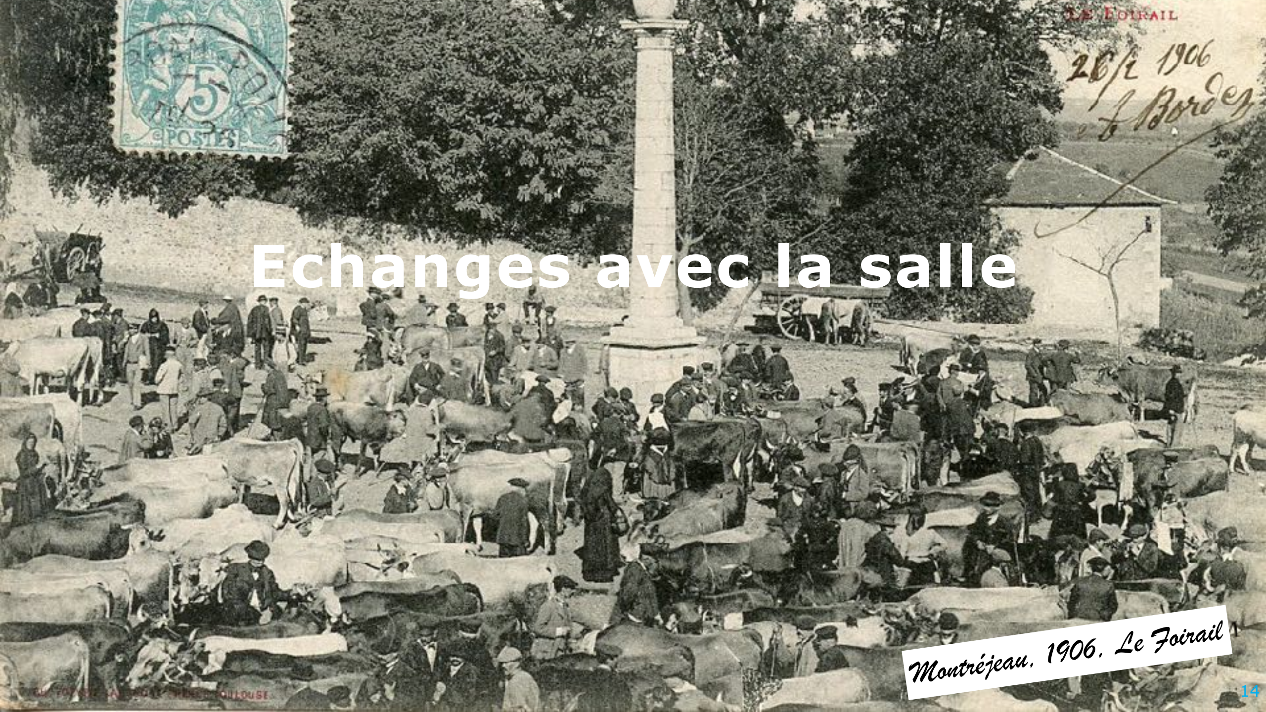
Montréjeau, 1906. Le Foirail